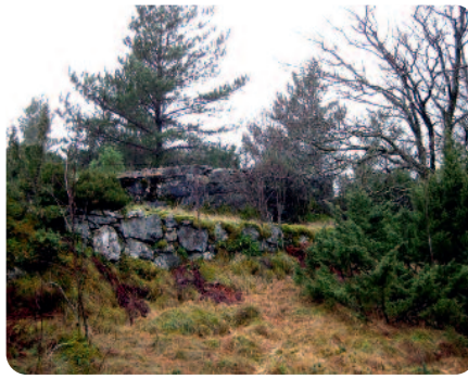
Dei gamle hustuftene og steingarden på Langeneset er godt synlege frå nordsjøløypa.