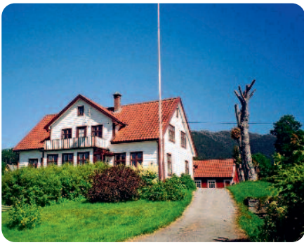
Hovudbygningen i Haavetunet blei bygd i 1850 og har sidan blitt utvida med arker og entré på vestsida.