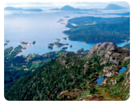
På toppen av Skålefjellet har ein utsyn mot Førdefjorden, øyane i vest og Høydalsfjorden.

var Stavang officersgård og kapteinen fekk alle dei gamle militære småtollane. Eigaren Lillenschold fekk landskylda og Svanegodset fekk tienda. Kring 1700 budde det ein strandsittar på ein av holmane i Stavangundet. Martens- familien i Hellevika skulda han for å drive med ulovleg sal av øl og tobakk. Sjølv hadde dei handelsbrev på sal av tobakk, øl og brennevin. I 1801 budde det 85 personar i Hellevik, Stavang og Stavik til saman. Hundre år seinare var folketallet kring 200. Dei som budde her var fiskarar, noteeigarar, gardbrukarar, tenestefolk, sjømenn, postopnar og prest.