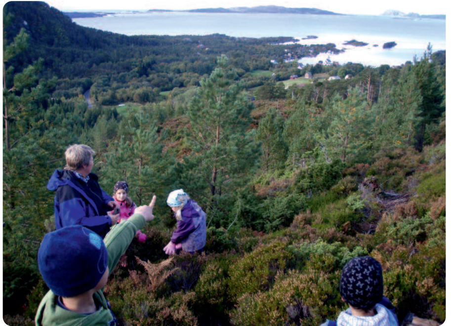
På Åsen kjem ein nær naturen. Her ser ein mange tre som stod i vegen for den kraftige nyttårsorkanen 1. januar 1992. Du kan også ta ein tur inn i den gamle skogen der det verkar som om tida har stoppa opp.

Om våren kjem svalene og byggjer reir i låvar og naust. Dyrelivet langs sjøkanten ber preg av