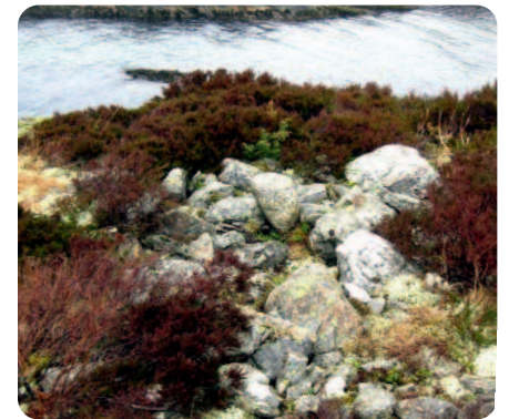
Gravrøys tytt på Langeneset.

I Stavang finn ein gravrøyser, steinsirklar, og spor etter gamle buplassar frå sein steinalder og tidleg bronsealder. I 1427 var Stavang, Selvika og Stokkebekken ein del av Munkelives jord. I 1680