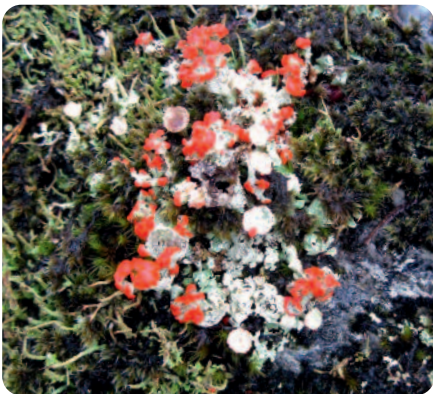
Trompetlav. I fylgje segna bles alvane i laven sine trompetar!

Eit karaktertrekk ved Stavang er dei mange sjøhusa langs sjøkanten med den store kyrkja i midten. Nordsjøløypene er laga slik at ein kan velje mellom ulike vanskegrad, anten ein vil gå ein lett tur frå butikken til Langeneset eller ein tyngre tur til Hornfjellet. Den lengste løypa går frå Velteplassen til toppen av Skålefjellet (765 moh.).