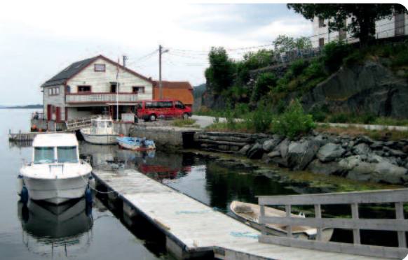
Gjestehamna i Stavang.

Stavang ligg 45 minutt med bil frå Florø og Førde. Frå Florø køyrer ein via Eikefjord og til Stavang. Frå Førde tar ein til venstre i vegkrysset i Naustdal og køyrer utover langs Førdefjorden.